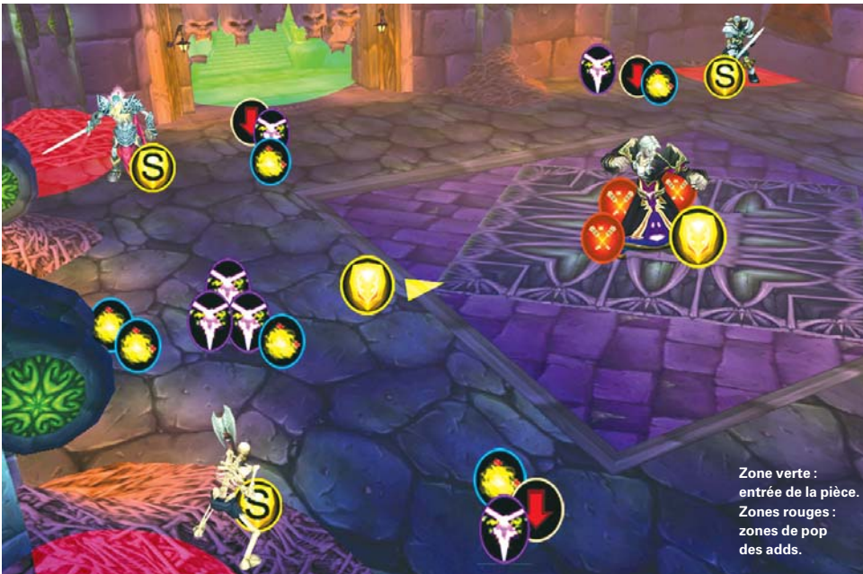
Noth est tanké au centre de la pièce par le MT tandis que l'intégralité des DPS en mêlée s'active dans son dos ; le second MT se tient prêt à récupérer Noth aussitôt après son Transfert. Les trois groupes en charge des adds se mettent en position dans les coins nord-est, nord-ouest et sud-ouest.