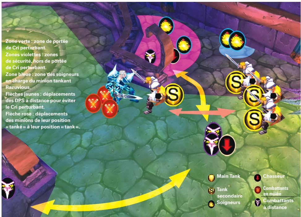
Un positionnement qui doit être parfaitement respecté... Razuvious est tanké dans la pente par le minion sous CM pendant que les trois restants sont tankés en haut de la pente, en position pour le prochain CM. Les soigneurs restent en zone de sécurité en permanence ; les casters font l'aller-retour à chaque Cri perturbant.

taunter et prendre l'aggro de Razuvious. Chacune de ces deux Aptitudes dure 20 secondes : le relais entre deux minions se fera donc toutes les 20 secondes (ils ne sont pas capables d'encaisser Razuvious sans le Mur) et ils devront être laissés tranquilles une minute ensuite, le temps que leur Provocation se recharge. Vous en déduirez facilement qu'il faut un minimum de trois minions pour effectuer un roulement correct : évitez donc de les laisser mourir, ils ne repoperaient plus comme c'était le cas il y a quelques mois.